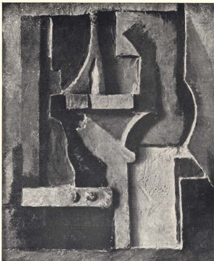
M. JANCO: RELIEF A7