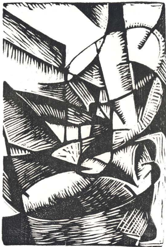
E. PRAMPOLINI: BOIS