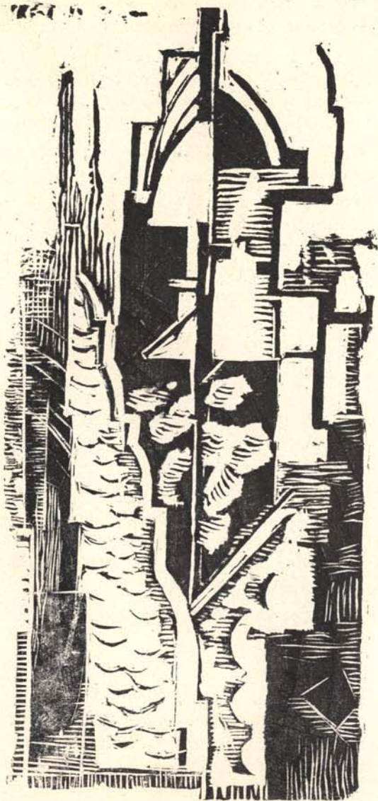
M. JANCO: BOIS