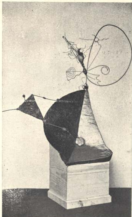
M. JANCO: CONSTRUCTION 3