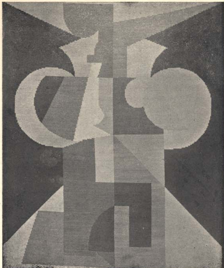
H. ARP: BRODERIE