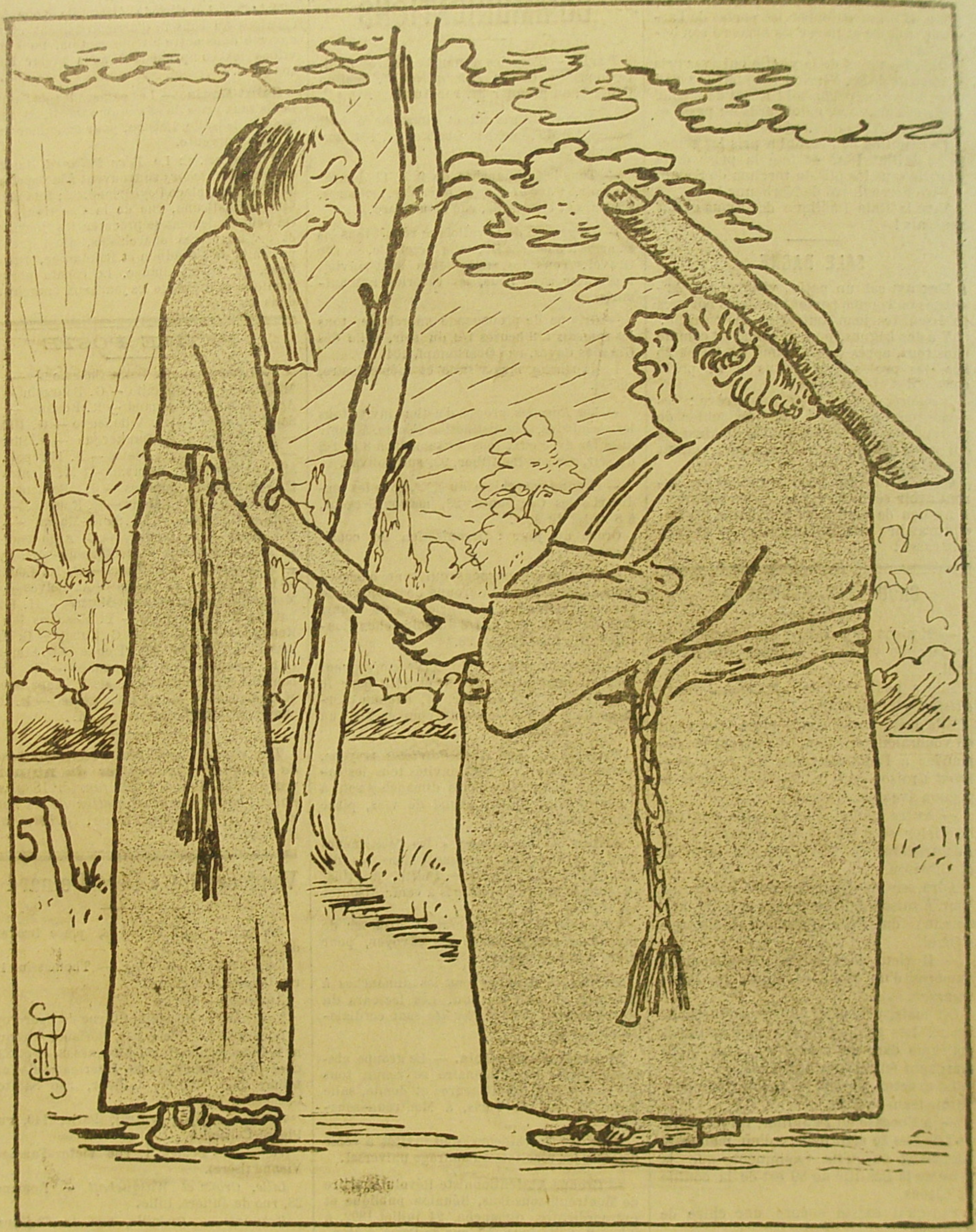
— Bondieu, de quel pays de sauvages sors-tu ? Viens en France, on s'y engraisse toujours, vois plutôt mon ventre : la République est une bonne garce, y a mèche de s'acoquiner avec elle !