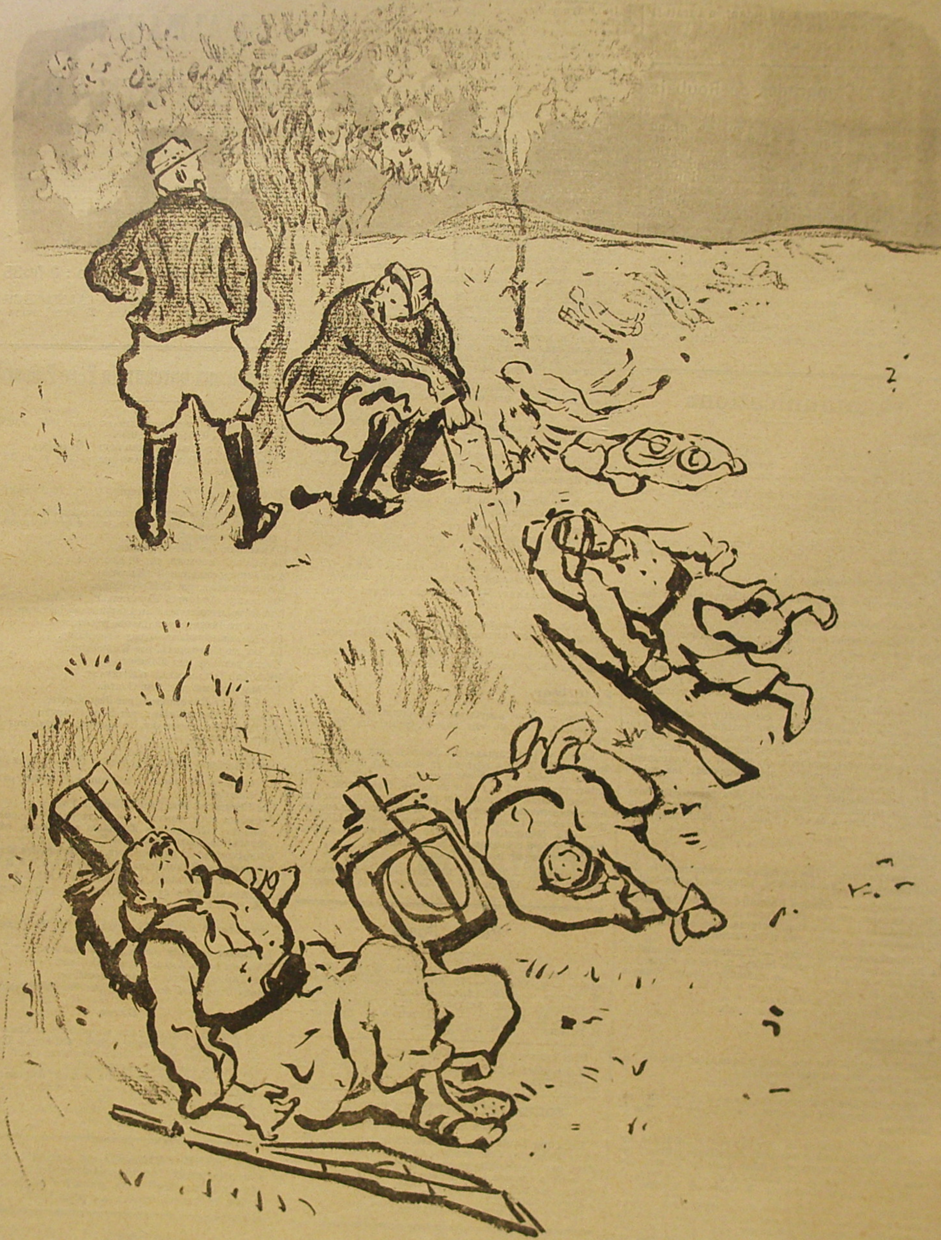
LE COLON. — Pellieux les conduit à la boucherie; nous, on les fait cuire!